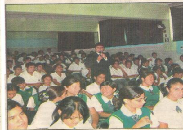
PRESENTE. El futuro del país tiene una herramienta educativa en el presente.

Asimismo, el director indicó que se empezará a capacitar a las pequeñas y medianas empresas de la región Lambayeque, y en cuanto a universidades empezarán con la Universidad Particular de Chiclayo.