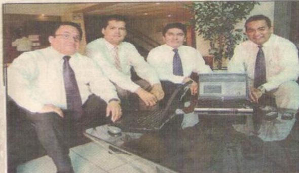
EQUIPO. Detrás de un buen blog hay un buen grupo humano y profesional.

4] El director estuvo presente en la Universidad de Piura compartiendo sus experiencias como editor del blog que promociona negocios exitosos del departamento de Lambayeque, y señaló que gracias al alcance que tienen, los blogs son herramientas poderosas de marketing que contribuyen a que una marca se haga conocida y ocupe una buena posición en el mercado.